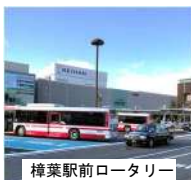
樟葉駅前ロータリー