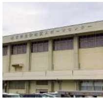
伊加賀スポーツセンター