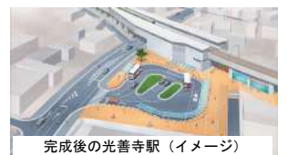
完成後の光善寺駅 (イメージ)