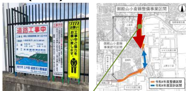
今回の契約締結は北側部分（南側は既に工事中）