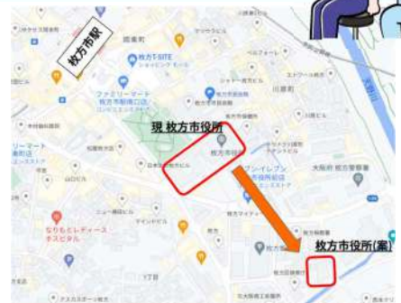
議案上の新所在地は現在の市役所第2分館だった