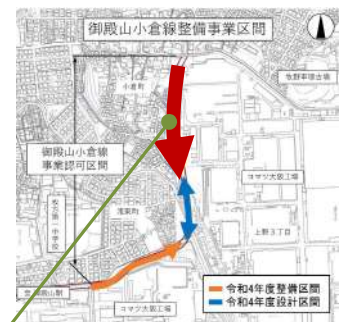
今回の契約は北側部分（南側は工事中）