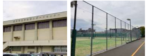
伊加賀スポーツセンター

市答弁 テニスコートや陸上競技場など、特有の設備を持つ施設については個別の整備計画はない