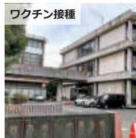
ワクチン接種 常設の集団接種会場となる市民会館