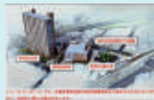
光善寺駅前再開発 計画イメージ