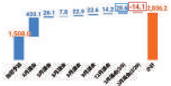
令和2年度一般会計予算 当初予算額からの補正額推移（億円）

新型コロナウイルスワクチン接種経費の多くを令和3年度予算に組み替えたため3/29に減額補正