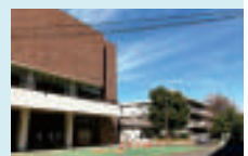
④街区 市民会館 大ホールなどの跡地

④街区は、魅力ある市駅周辺再整備を実現して行く上で中核となる重要なエリアであると認識している。枚方市駅前の大空間を創出し、広域中心拠点としての魅力を高め、市内外からさまざまな人やモノが集い交流する「まち」の実現に向けて取り組んでいく。