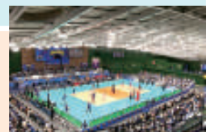
「観るスポーツ」の一つ バレーボール パナソニック パンサーズ

スポーツによる地域の活性化につなげる取り組みについて スポーツの力をまちのチカラに！ 「観るスポーツ」を市民とともに！